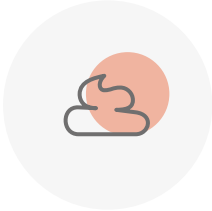
Heces poco coloreadas, con sangre o con hebras negras.