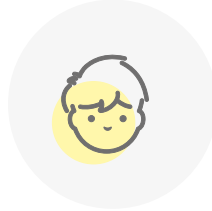
Ojos y/o piel amarillentos