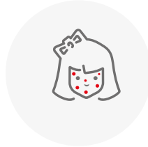
Picores y manchas en la piel (ronchas con o sin abultamiento, petequias, angiomas...)